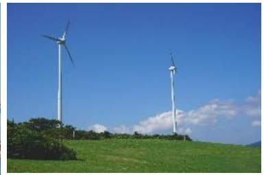
風力発電 太陽光パネル架台