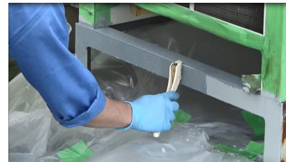
③サビオサエール塗装